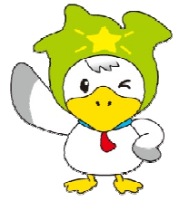
イメージキャラクター「カナモ」